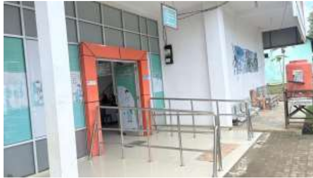
8. Ruang laktasi