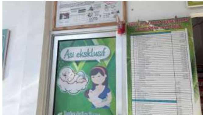
9. Sarana penunjang